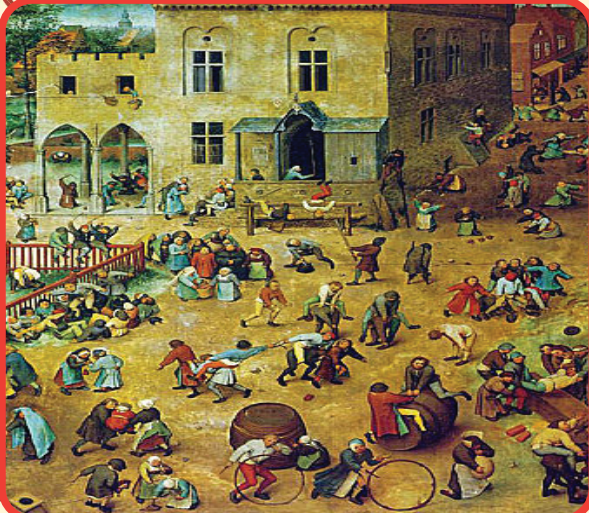
Jeux d'enfants de Bruegel l'Ancien