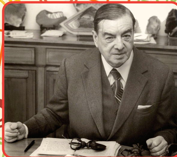
Les jeux et les hommes Livre de Roger Caillois