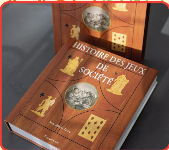
Histoire des jeux de société de Jean-Marie Lhôte