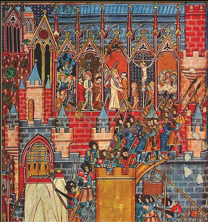
PREMIÈRE CROISADE LANCÉE PAR URBAIN V