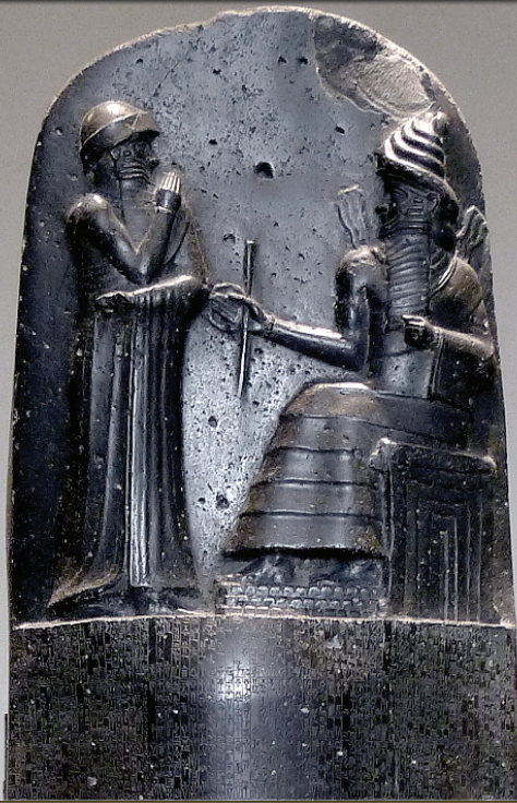
CODE D'HAMMURABI (PLUS ANCIEN CODE DE LOIS ÉCRIT)