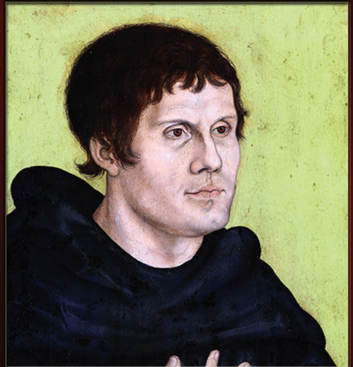
MARTIN LUTHER AFFICHE SES 95 THÈSES ET LANCE LA RÉFORME PROTESTANTE