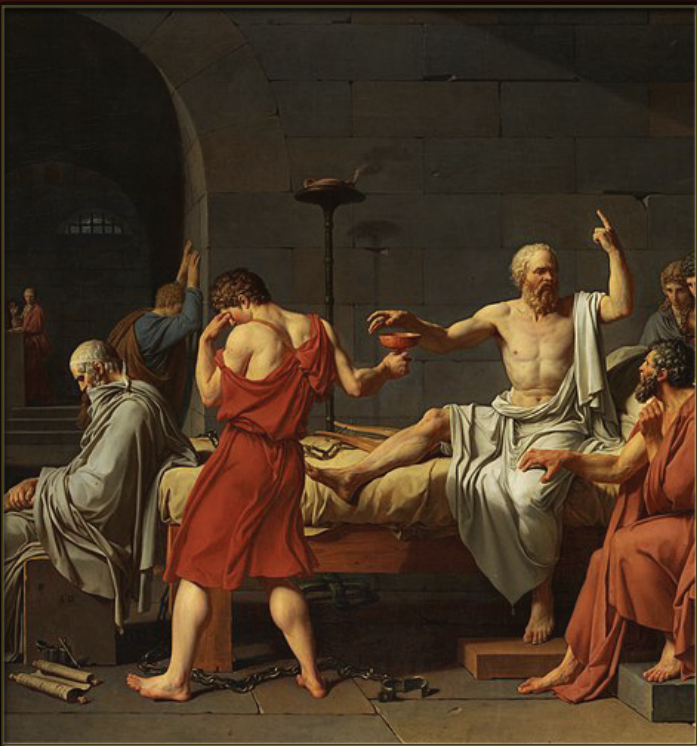
MORT DE SOCRATE À ATHÈNES