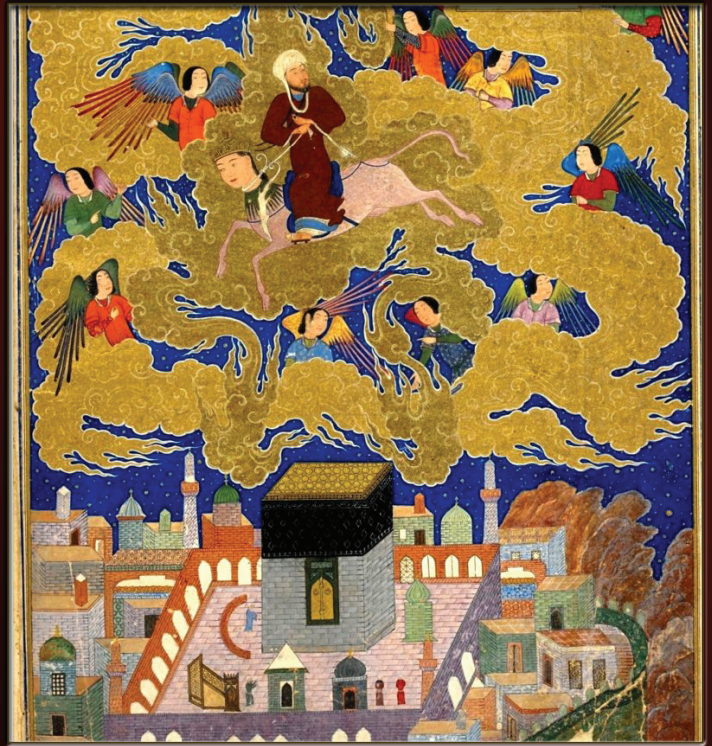
HÉGIRE (AN ZÉRO DE L'ÈRE MUSULMANE)