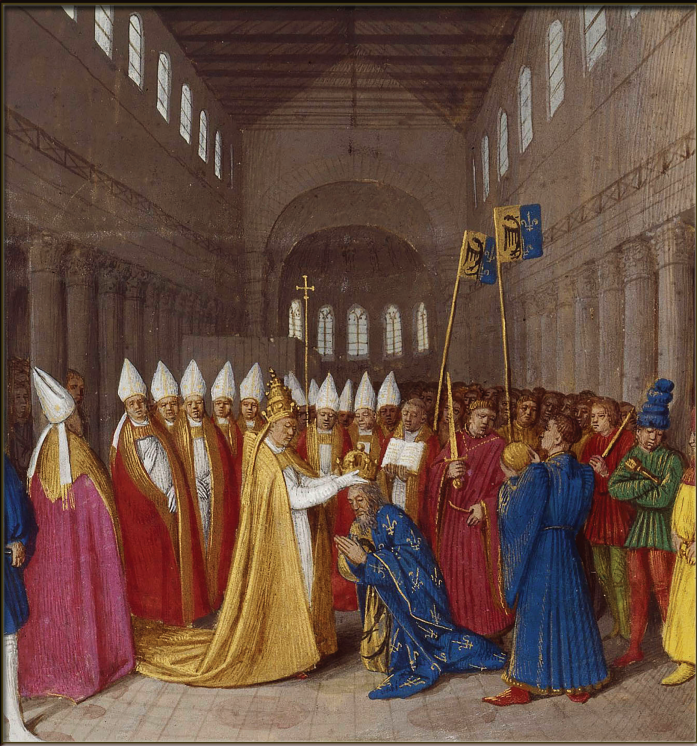
CHARLEMAGNE DEVIENT EMPEREUR ET RECONNAIT L'ÉVÊQUE DE ROME EN TANT QUE PAPE