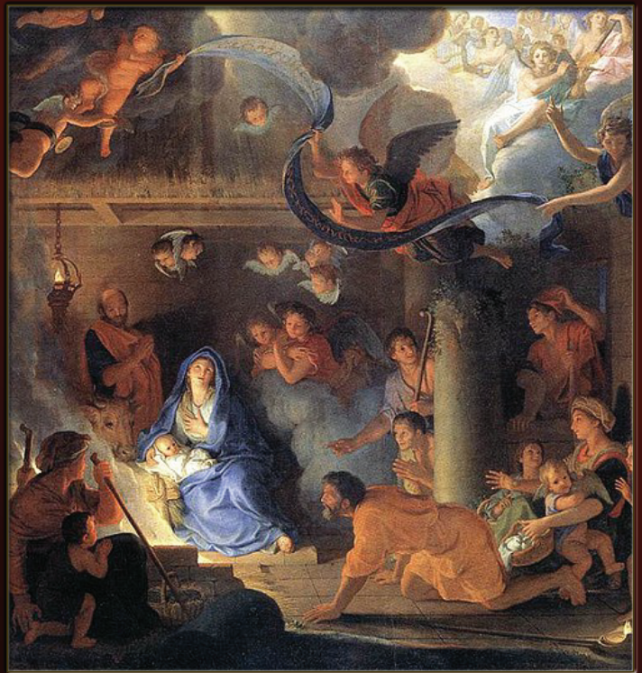
NAISSANCE DE JÉSUS (DÉBUT DE L'ÈRE CHRÉTIENNE)