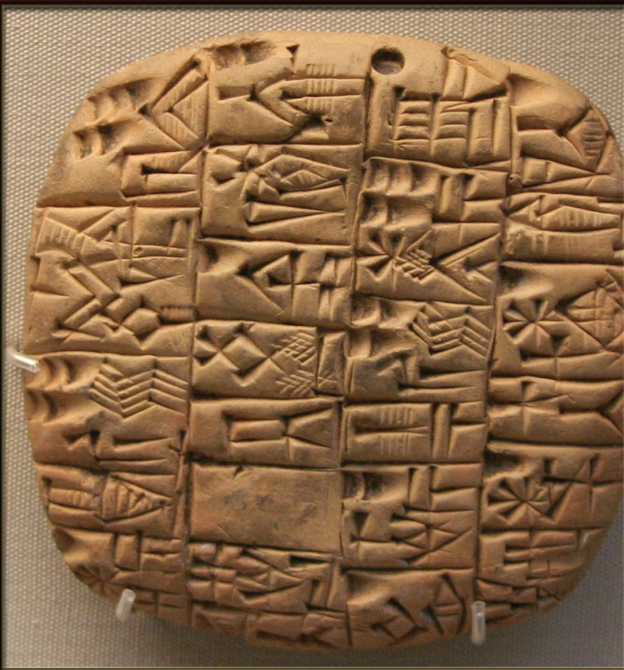
APPARITION DES PREMIERS SYSTÈMES D'ÉCRITURE