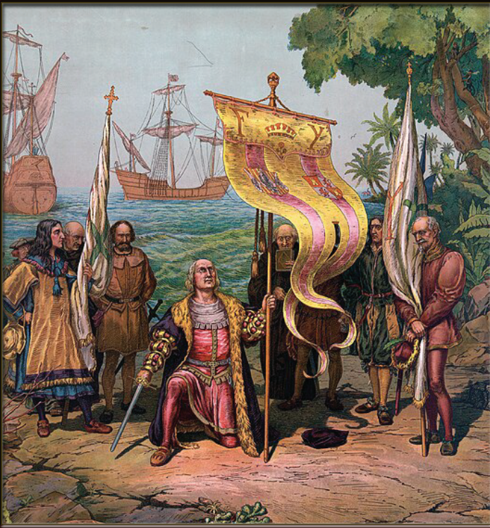
CHRISTOPHE COLOMB ATTEINT L'AMÉRIQUE (DÉBUT DE LA RENAISSANCE)