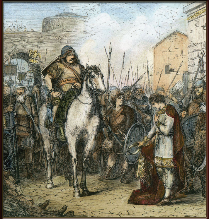
CHUTE DE L'EMPIRE ROMAIN D'OCCIDENT (ROME)