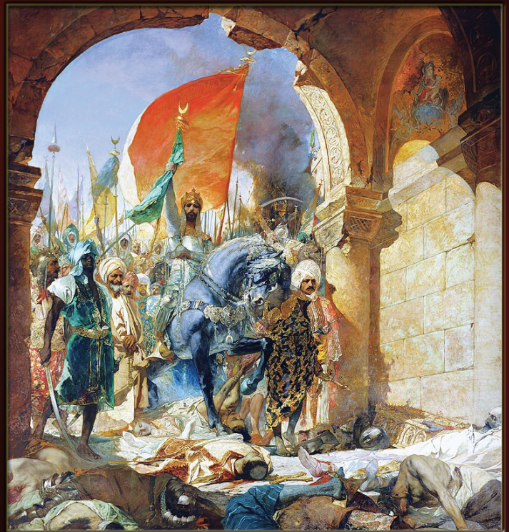
CHUTE DE L'EMPIRE ROMAIN D'ORIENT (CONSTANTINOPLE)