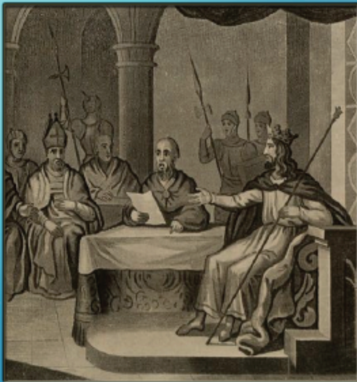
PREMIÈRE LOI INTERDISANT LE SERVAGE DANS LE ROYAUME DE FRANCE