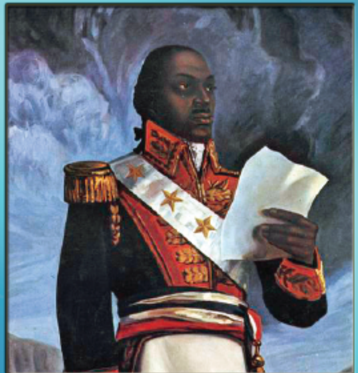
RÉVOLUTION HAÏTIENNE : PREMIÈRE RÉPUBLIQUE NOIRE LIBRE