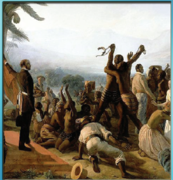
DÉCRET D'ABOLITION DE L'ESCLAVAGE EN FRANCE ET DANS LES COLONIES