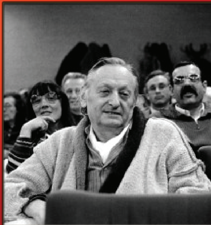
RÉDACTION DU MANIFESTE DE PEUPLE ET CULTURE