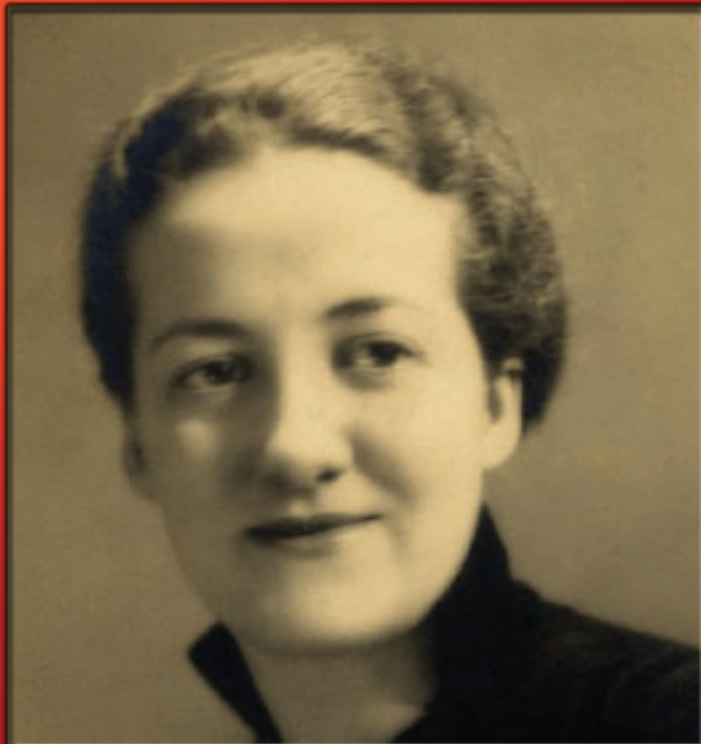
GERMAINE TILLION CRÉE LES PREMIERS CENTRES SOCIAUX ALGÉRIENS