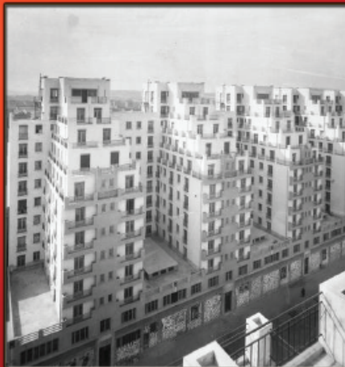
"DÉCLARATION DE VILLEURBANNE" PAR LES DIRECTEURS ET DIRECTRICES DE MJC